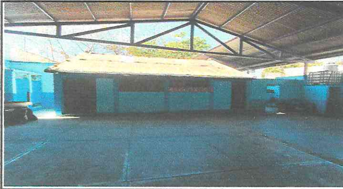
Foto1: Sustitución de lámina por lámina.