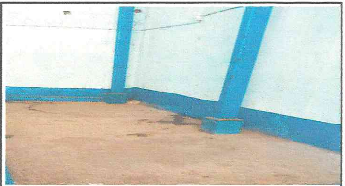
Foto 4: Remozamientos de paredes de cocina, suministro e instalación de tubería de agua e instalación de sistema eléctrico.